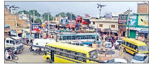
फतेहाबाद। रतिया के संजय गांधी चौक पर लगा जाम।