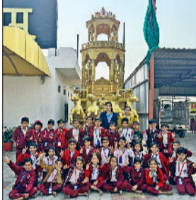
हिसार। महारानी लक्ष्मी बाई त्रिलोकचंद स्कूल में आयोजित बाल दिवस कार्यक्रम में बच्चे व अध्यापकगण।

महारानी लक्ष्मी बाई त्रिलोकचंद स्कूल, भिवानी रोहिल्ला में 14 नवंबर को बाल दिवस उत्साह एवं उमंग के साथ मनाया गया। इस दिन की शुरुआत विद्यालय के प्रांगण में आयोजित विशेष प्रार्थना सभा से हुई, जिसमें समस्त छात्र-छात्राएं और शिक्षकों ने सहभागिता निभाई। बच्चों को बाल दिवस के महत्व पर प्रकाश डालते हुए अध्यापकों ने पंडित जवाहरलाल नेहरू का स्मरण किया और उन्हें बच्चों के प्रिय 'चाचा नेहरू' संबोधन से याद