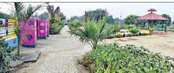
भूमा। जांडली कला गांव में स्वच्छता और हरियाली की अनोखी पहचान बना पाई।

जिले के भूमा भूमा का गांव जांडली कला आज अपने विकास, स्वच्छता और हरियाली की अनोखी पहचान के कारण शहरों को भी पीछे छोड़ रहा है। गांव में प्रवेश करते ही वातावरण ऐसा महसूस होता है जैसे किसी सुव्यवस्थित टाउनशिप में आ पहुंचे हों, चारों ओर हरियाली, साफ-सुथरी सड़कें, आधुनिक सुविधाएं और लोगों में विकास के प्रति गजब का उत्साह। गांव की सीमा में कदम रखते ही हजारों की संख्या में लगाए गए पेड़-पौधे स्वागत करते हैं। पेड़ों पर पक्षियों की चहचाहाट और हवा में घुली